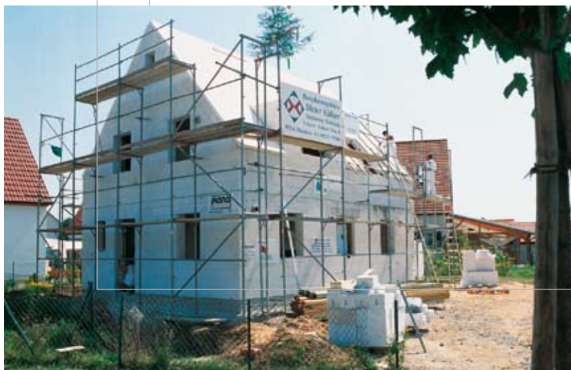
Beim Neubau dieser Einfamilienhäuser kam die MULTIPOR Mineraldämmplatte auf massiven Wänden und Dächern zum Einsatz.

Wärmedämm-Verbundsysteme mit MULTIPOR Mineraldämmplatten überzeugen bei Objekten beliebiger Grösse durch massiven, stabilen Aufbau, Feuersicherheit und Diffusionsoffenheit.