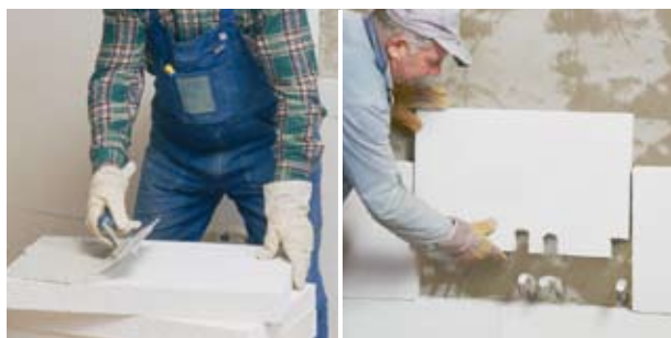
Zur Innendämmung wird die MULTIPOR Mineraldämmplatte einfach auf die Wand geklebt.

Bei der nachträglichen Dämmung von Innenwänden sind MULTIPOR Mineraldämmplatten eine langfristig sichere Alternative zu anderen Dämmstoffen.